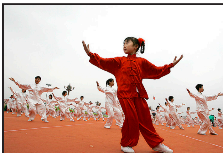
Entspannung. Chinesischer Breitensport Tai-Chi.

Das Buch: China Gold: China's Quest for Global Power and Olympic Glory; ISBN 978-1-933782-64-5.