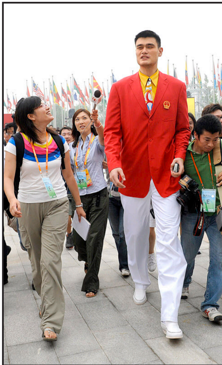
Hysterie. Chinas grösster Sportler, Basketballer Yao Ming.